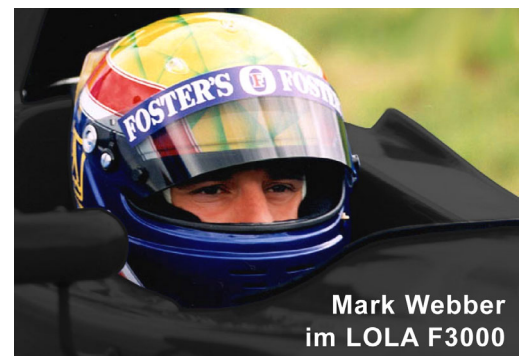
Mark Webber im LOLA F3000

Der Kursablauf ist auf Ihre Vorkenntnisse abgestimmt. Newcomer absolvieren z.B. ein Aufbautraining im Formel Renault um dann im Anschluß als Tages-Highlight den fast drei Mal so starken F3000 besser um den Rundkurs pilotieren zu können. Freuen Sie sich auf ein Hi-Speed Erlebnis ersten Ranges!