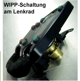
WIPP-Schaltung am Lenkrad