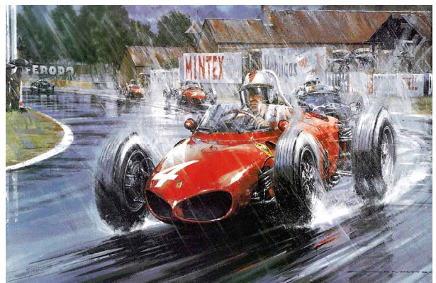
Kunstdruck „Der letzte Sieg“

Diese hochwertigen Automatik-Gedenkuren entstehen mit Genehmigung und der freundlichen Unterstützung der Gräflich Berghe von Trips'schen Sportstiftung zu Burg Hemmersbach in Kerpen-Horrem und seinem Motorsportverein, der Scuderia Colonia e. V. in Köln.